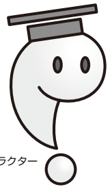
日本弁理士会の マスコットキャラクター はっぴよん